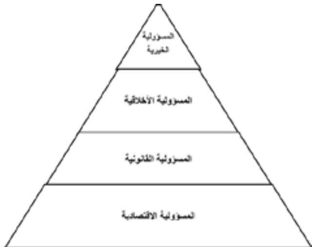
شكل رقم (١) نموذج كارول للمسؤولية الاجتماعية

والتأهيل المستمر، وغيرها من البرامج التي تساهم في خدمة المجتمع اقتصادياً.